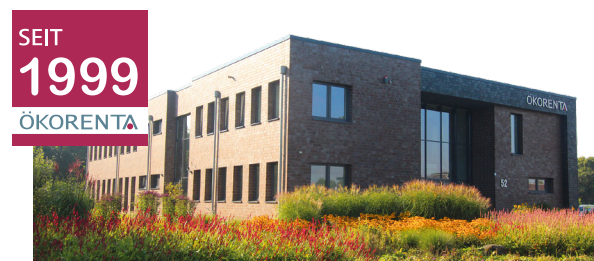
ÖKORENTA-Firmengebäude in Aurich, Ostfriesland

Zum Zeitpunkt der Auflage des Fonds sind weder Vermögensgegenstände erworben, noch stehen konkrete Vermögensgegenstände fest. Sie können sich vor der vertraglichen Bindung an die Fondsgesellschaft insofern kein vollständiges Bild über die Vermögensgegenstände und die damit verbundenen Risiken und Ertragschancen verschaffen. Anleger:innen gehen mit einer Beteiligung eine langfristige Verpflichtung ein - eine Veräußerung an Dritte ist nicht sichergestellt. Für eine vollständige Darstellung der Risiken sollten sie die Risikohinweise im Verkaufsprospekt vom 22. Juli 2022 im Kapitel „Risiken“ lesen. Der Verkaufsprospekt und die „Wesentlichen Anlegerinformationen“ sind kostenlos in elektronischer Form auf unserer Website unter www.oekorenta.de/downloads und in gedruckter Form in deutscher Sprache bei der Auricher Werte GmbH, Kornkamp 52, 26605 Aurich oder bei Ihrem Berater erhältlich.