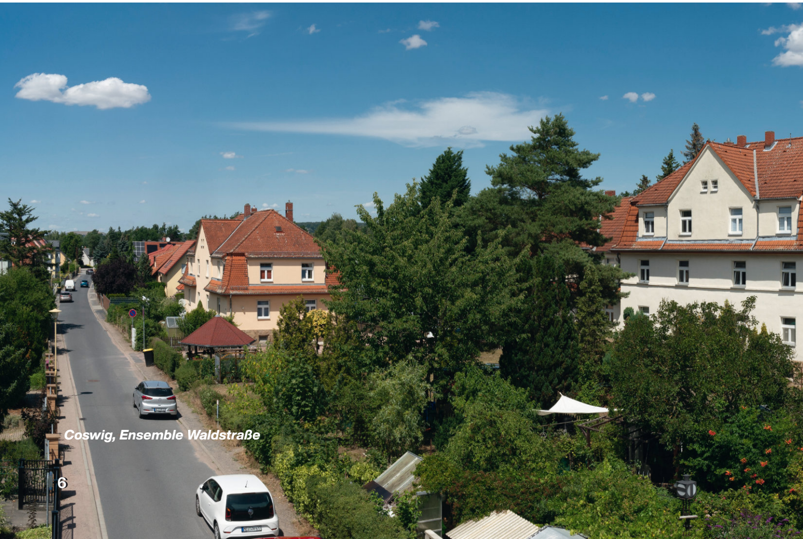
Coswig, Ensemble Waldstraße