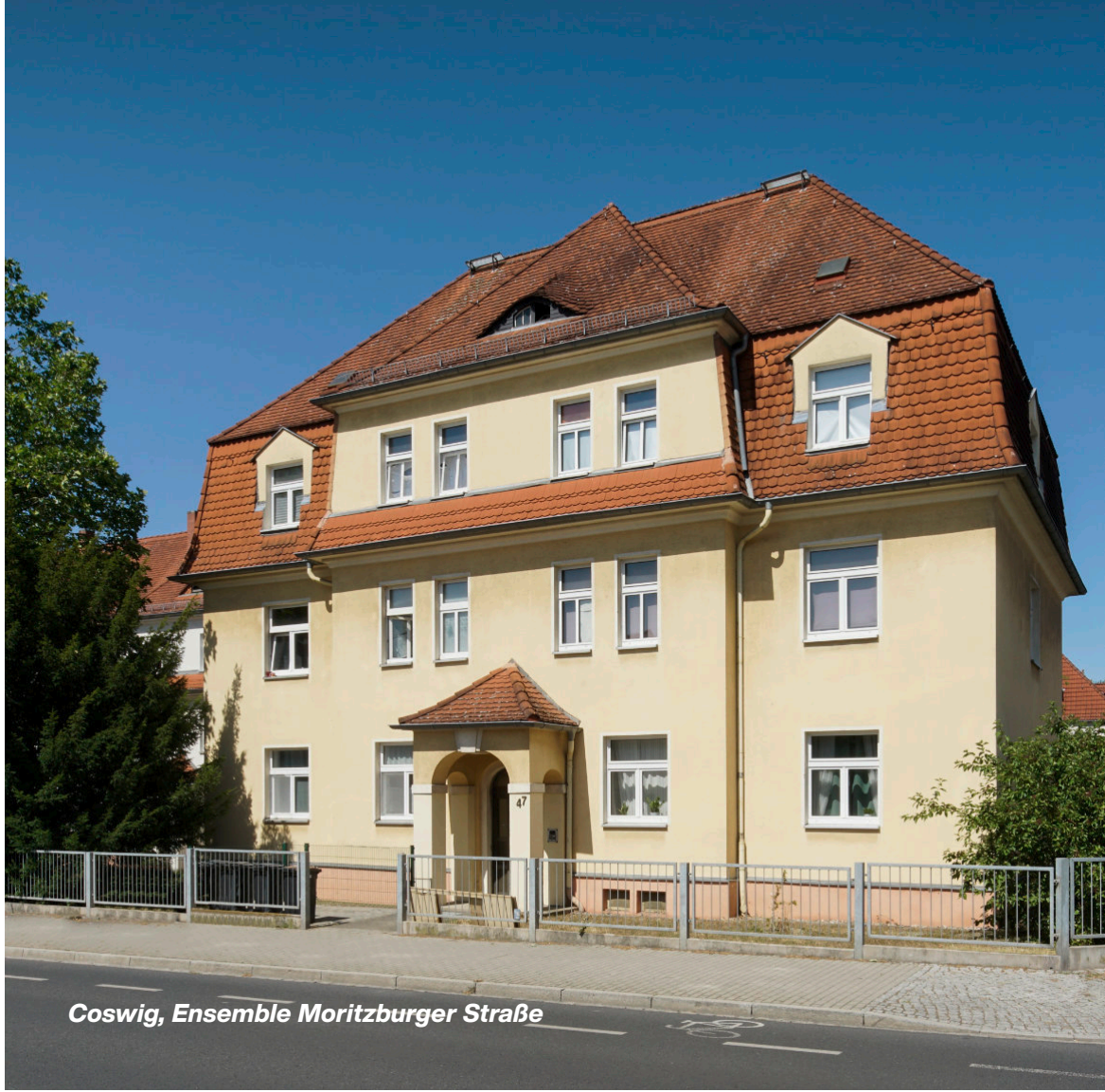
Coswig, Ensemble Moritzburger Straße