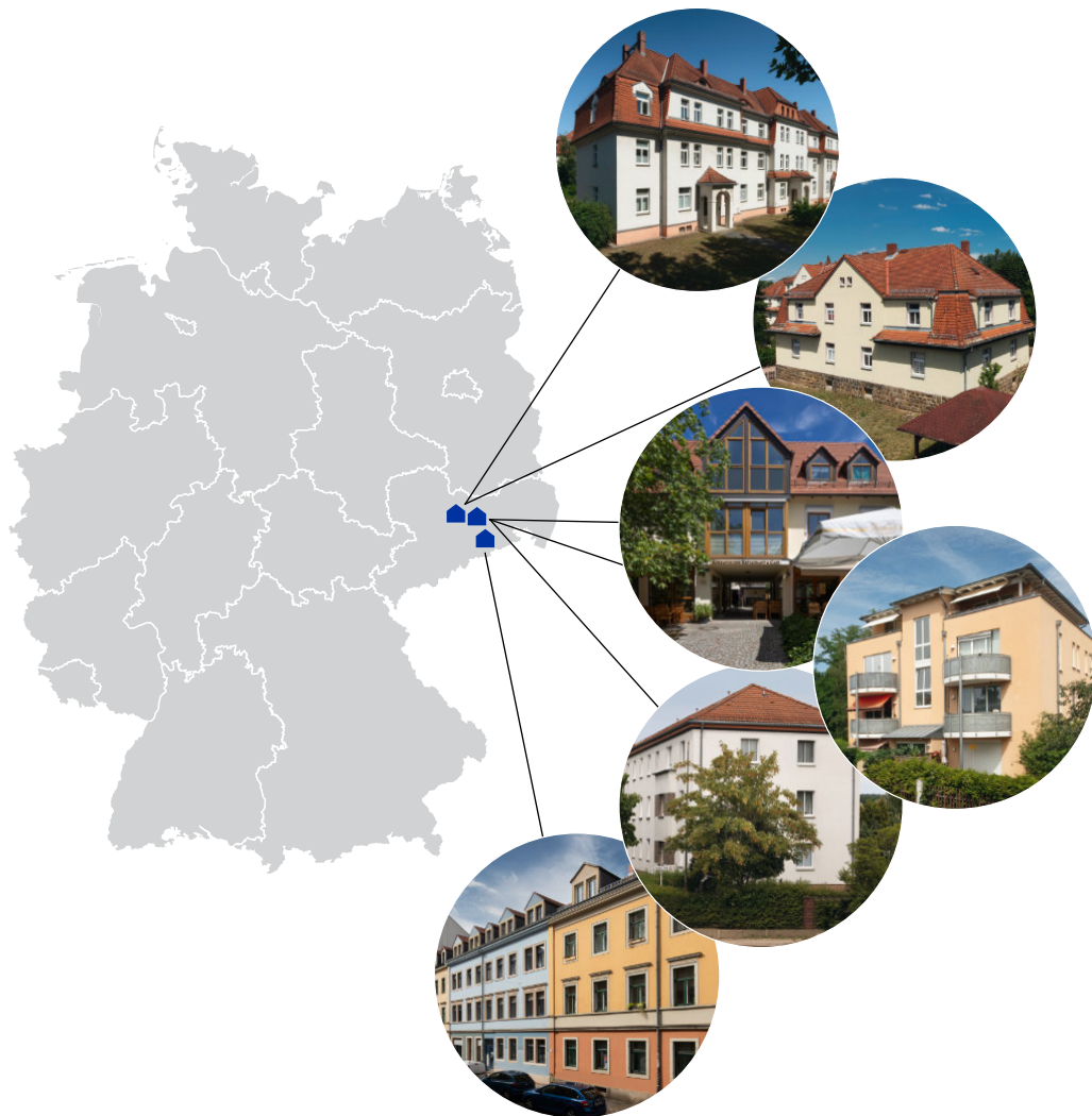
Die 6 Standorte der Objekte des Startportfolios in Dresden, Coswig und Radebeul