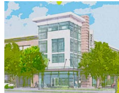
Cayce Self-Storage, Konzeptgrafik (Cayce, South Carolina)