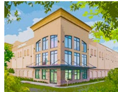
Ormond Beach Self-Storage, Konzeptgrafik (Ormond Beach, Florida)