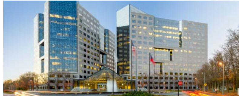
The Towers at Wildwood Plaza (Atlanta, Georgia)