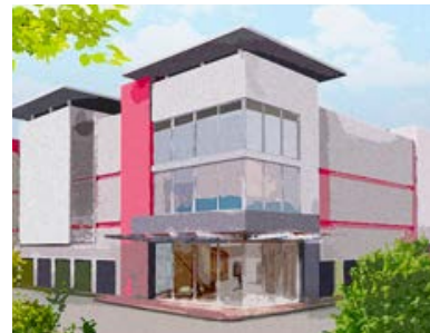
Tamiami Trail Self-Storage, Konzeptgrafik (Port Charlotte, Florida)