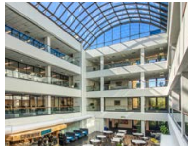
Colonial Life Corporate Campus (Columbia, South Carolina)