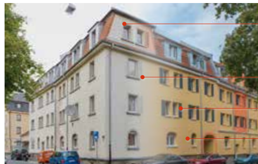
Schweinfurt, Seestraße (ICD 5 R+)