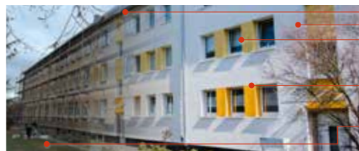
Bad Kreuznach, Steinkaut (ICD 8 R+)