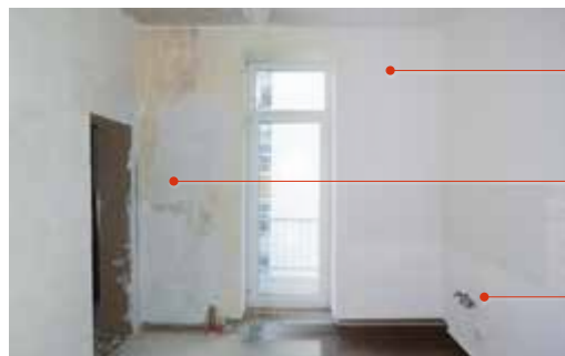
Leipzig, Bernhard-Göring-Straße (ICD 5 R+)